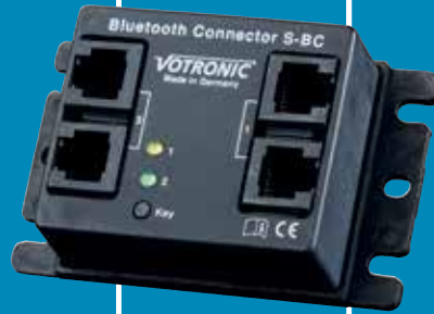
BLUETOOTH CONNECTOR S-BC