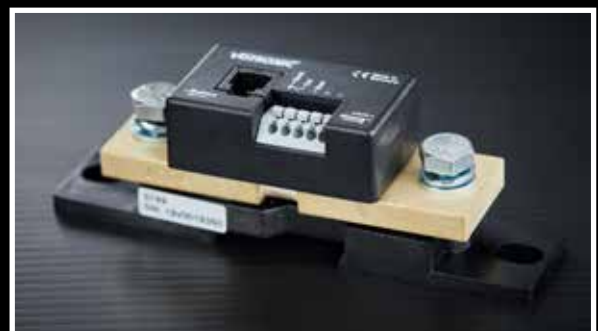
Smart-Shunt 100 A, 200 A oder 400 A (Präzisions-Messwiderstand), im Lieferumfang enthalten

Mit dem Bluetooth-Connector S-BC und der Energy-Monitor-App können Sie sich die Werte des Batterie- und Solar-Computers auch über das Handy oder Tablet anzeigen und speichern lassen.